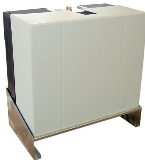
Centrala deszczowa Aquamatic Domestic C Plus

Wszystkie przyłącza wykonano ze złączek skręcanych. Pompa oraz zbiornik podręczny zabezpieczone są podkładkami tłumiącymi drgania. Centralę można zamocować na ścianie lub na podłodze.