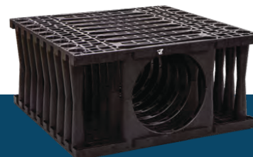
PiVoid XL Optimus