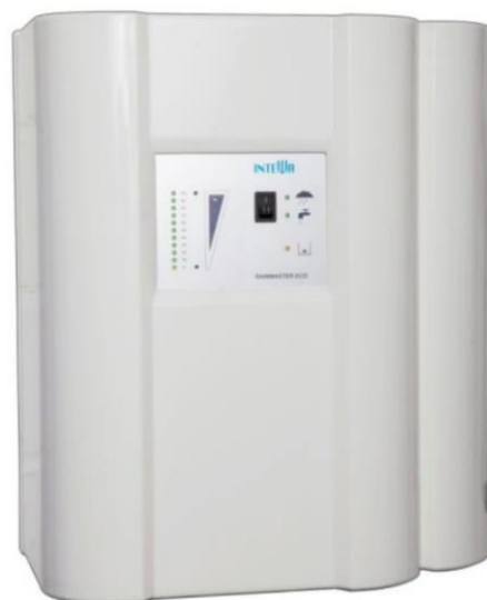
Centrala deszczowa EcoRain 10