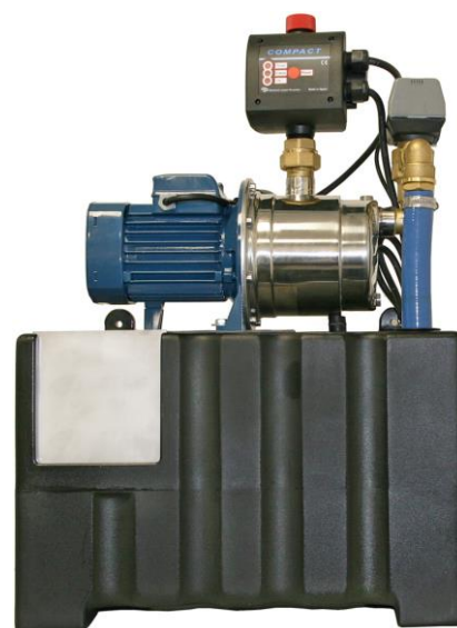
Centrala deszczowa Aquamatic Domestic S Plus

Centralę można zamocować na ścianie lub na podłodze.