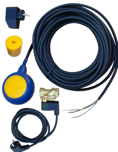
Rys. 1. Zestaw opróżniający ECO