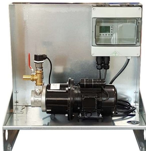
Przykładowa konsola techniczna ze sterownikiem i pompą filtratu