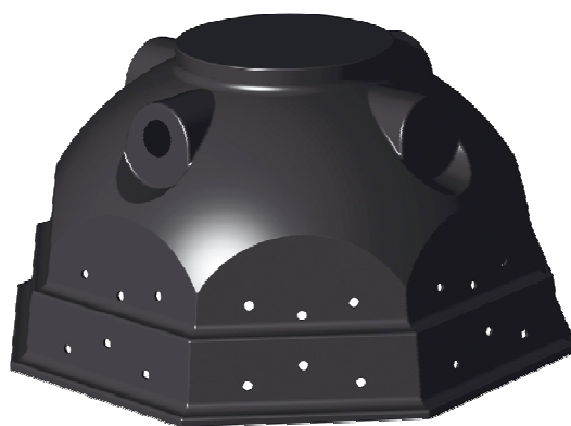
Studnia Igloo 900 l